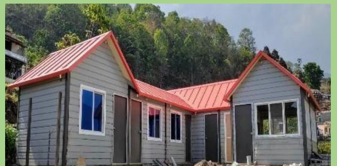
डिलर: सारु ट्रेडिङ्ग परियोजना: आवासीय घर (६५० वर्ग फुट)