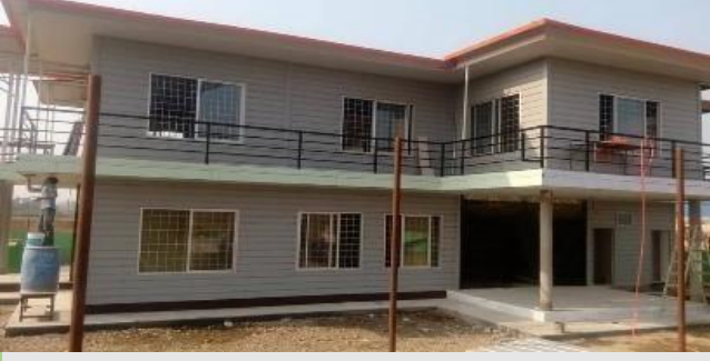
डिलर: छार नेपाल कन्सट्रक्सन परियोजना: आवासीय घर (८२० वर्ग फुट)