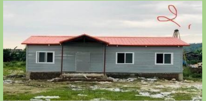
डिलर: महालक्ष्मी निर्माण सेवा परियोजना: आवासीय घर (५०० वर्ग फुट)