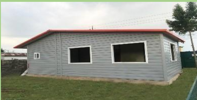
डिलर: पंचकोशी डेभलपर्स परियोजना: कार्यालय (४५० वर्ग फुट)