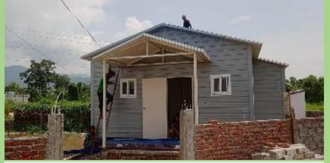
डिलर: जीपीएसटिआर हाउसिंग परियोजना: आवासीय घर (७०० वर्ग फुट)