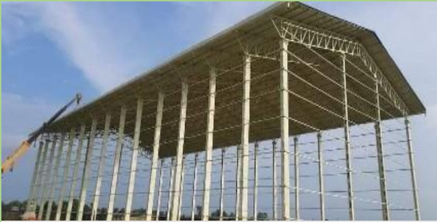
डिलर: केटिएम बिल्डर्स परियोजना: इंडिगो पेंट्स (१२०० वर्ग फुट)