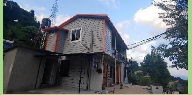
डिलर: एम बि कोरियन परियोजना: आवासीय घर (७२० वर्ग फुट)