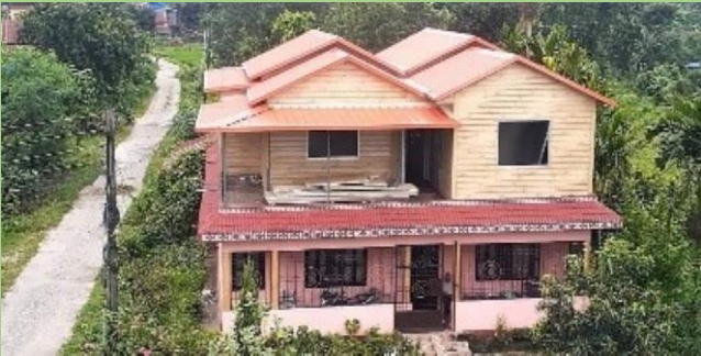
डिलर: समृद्धि निर्माण सेवा परियोजना: आवासीय घर (८०० वर्ग फुट)